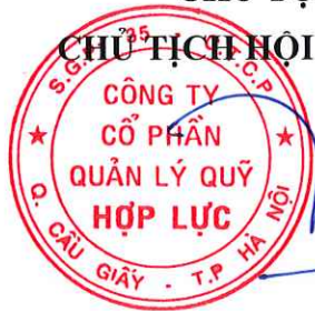
Đàm Mạnh Cường